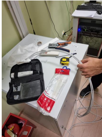
Рис. 5: Рабочее место в серверной