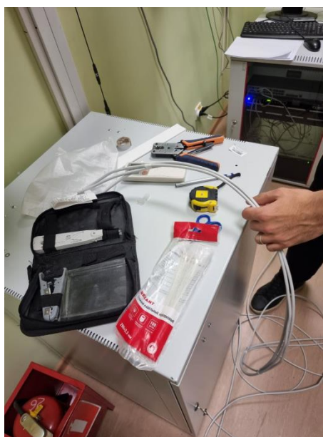
Рис. 4: Необжатые кабели

Обжим концов кабелей, находящихся в серверной не составил труда из-за простоты доступа к ним (на рисунке 4 приведена фотография из серверной с необжатыми кабелями). Однако обжим концов кабелей, проложенных к свитчам, являлся крайне трудоемким из-за необходимости работы при наличии следующих усложняющих факторов: большое количество иных кабелей, работа на весу и на высоте. На рисунке 5 продемонстрирована обстановка в которой мне было необходимо обжимать кабели (данная фотография была сделана в процессе тестирования кабельной линии).