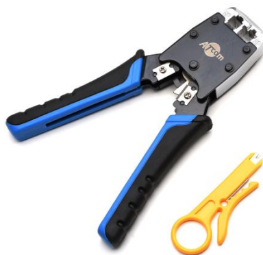
Рис. 3: Инструмент для обжимки

Обжим концов кабелей, находящихся в серверной не составил труда из-за простоты доступа к ним (на рисунке 4 приведена фотография из серверной с необжатыми кабелями). Однако обжим концов кабелей, проложенных к свитчам, являлся крайне трудоемким из-за необходимости работы при наличии следующих усложняющих факторов: большое количество иных кабелей, работа на весу и на высоте. На рисунке 5 продемонстрирована обстановка в которой мне было необходимо обжимать кабели (данная фотография была сделана в процессе тестирования кабельной линии).