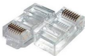
Рис. 1: 8P8C штекер

На этапе проектирования и прокладки кабельной линии (STP Ethernet CAT.5e) были проложены кабели, идущие от сервера до L2 свитчей на каждом этаже. Для того, чтобы данные кабели могли быть включены в сеть, их необходимо обжать, то есть на концах кабелей установить штекеры 8P8C (пример приведен на рисунке 1), которые и будут подключаться в свитчи и патч-панель сервера.