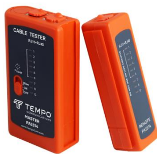
Рис. 6: Устройство для тестирования линии

Проложенная кабельная линия была подключена к серверу и свитчам, только после того, как каждый кабель был проверен на работоспособность и были отключены старые кабели, отвечавшие за передачу интернета. На этом, поставленная на данном этапе задача была выполнена.