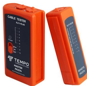
Рис. 6: Устройство для тестирования линии

Проложенная кабельная линия была подключена к серверу и свитчам, только после того, как каждый кабель был проверен на работоспособность и были отключены старые кабели, отвечавшие за передачу интернета. На этом, поставленная на данном этапе задача была выполнена.