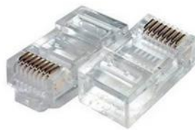
Рис. 1: 8P8C штекер

На этапе проектирования и прокладки кабельной линии (STP Ethernet CAT.5e) были проложены кабели, идущие от сервера до L2 свитчей на каждом этаже. Для того, чтобы данные кабели могли быть включены в сеть, их необходимо обжать, то есть на концах кабелей установить штекеры 8P8C (пример приведен на рисунке 1), которые и будут подключаться в свитчи и патч-панель сервера.