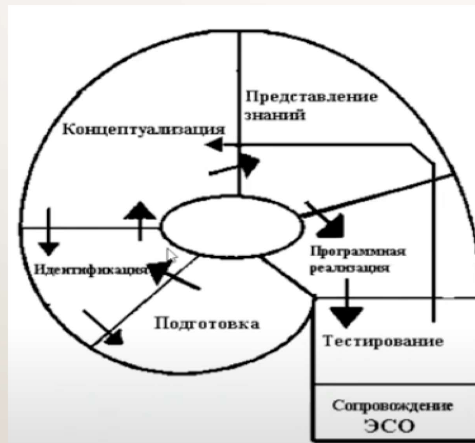
Рисунок 1 — Жизненный цикл экспериментальной системы (ЭС)