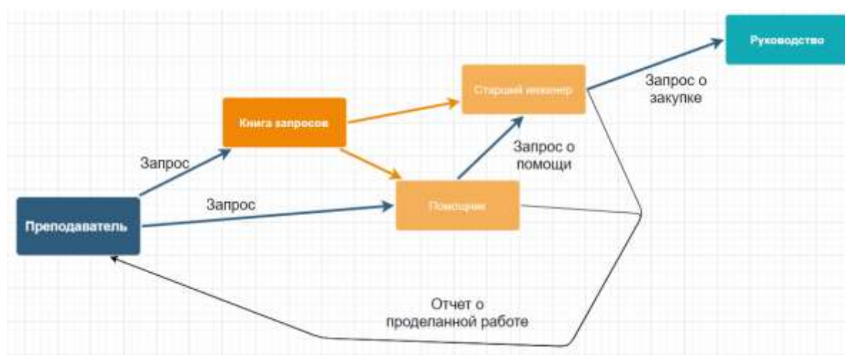
Рисунок - Алгоритм обработки и выполнения заказа

Механизм организационной деятельности – каждый берет часть работы, заранее описанной в книге заказов или обговоренной в устной форме, если помощник не может выполнить задачу он обращается к старшему. Если задача не выполнима, то вопрос решается с директором.